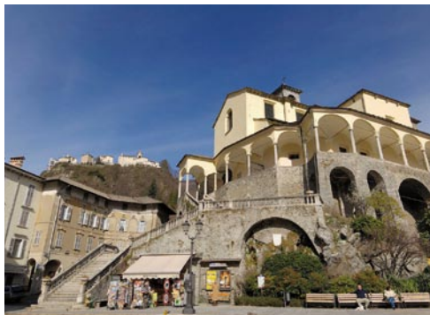
COLLEGIATA DI SAN GAUDENZIO

" Natura " come rapporto tra la natura ecologica che costituisce il contesto del Sacro Monte e quella umana dei pellegrini, invitati a comprendere la propria condizione creaturale mediante la contemplazione del Dio fattosi uomo, morto e risorto nella nostra natura, da Lui poi elevata nella Risurrezione.