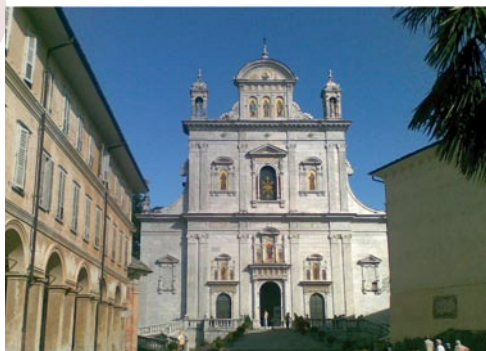
BASILICA DEL SACRO MONTE

Un luogo "speciale" dove tutto, dall'arte alla natura, concorre a narrare gli episodi salienti della vita di Cristo, inseriti in scenografiche architetture all'interno delle quali statue a grandezza naturale e mirabili affreschi raccontano un'unica storia.