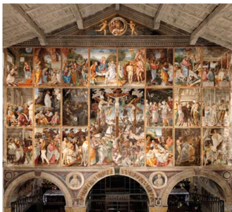
PARETE GAUDENZIANA IN S. M. DELLE GRAZIE

Varallo può perciò essere considerato il luogo ideale dove proporre quella lettura spirituale delle opere di arte sacra di cui ormai si è persa memoria, ma che costituiva il vero fine per cui esse erano state commissionate e prodotte, come la celeberrima Parete Gaudenziana (1512-1513) che introduce il visitatore alla visita del Complesso Monumentale del Sacro Monte.