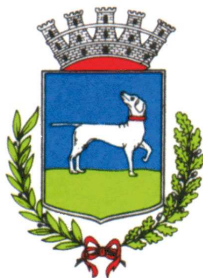
Comune di Varallo Sesia