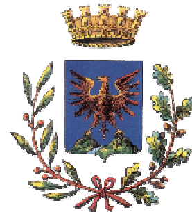
Comune di Borgosesia