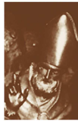
Diocesi di Novara