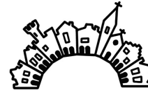
Progetto Culturale promosso dalla Chiesa italiana