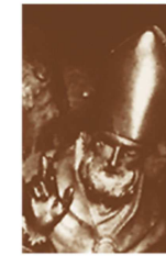
Diocesi di Novara