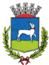
Comune di Varallo Sesia