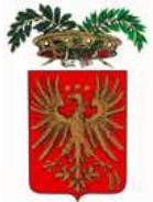
PROVINCIA DI NOVARA