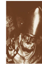
Diocesi di Novara