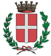
Comune di Novara