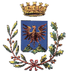
Comune di Borgosesia