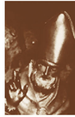
Diocesi di Novara