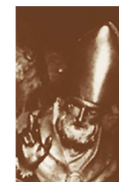
Diocesi di Novara

Progetto Culturale promosso dalla Chiesa italiana