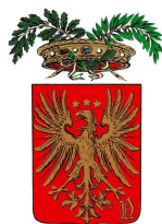
Provincia di Novara