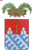
Provincia del Verbano Cusio Ossola