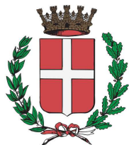
Comune di Novara