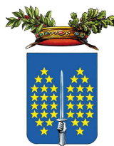
Provincia di Vercelli