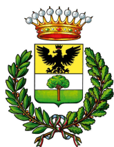
Comune di Verbania