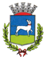
Comune di Varallo Sesia