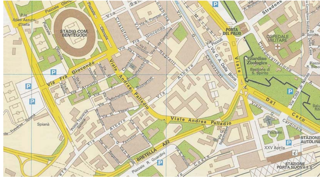
Figura 3 Verona, mappa della zona della Stazione (in basso a destra) e dello Stadio (in alto a sinistra)