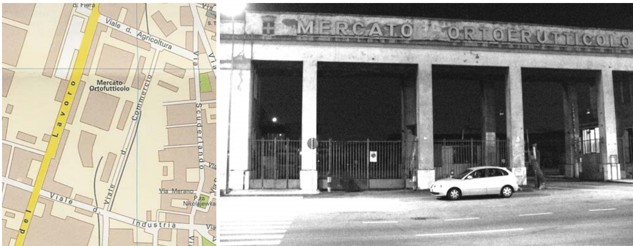
Figura 1 Verona, ubicazione del Mercato ortofrutticolo e foto dell'ingresso da Viale del Lavoro

Invitare i partecipanti a lasciare in pullman oggetti che costituiranno problemi di accesso allo Stadio / Palazzetto dello sport / parcheggio del Palazzetto: