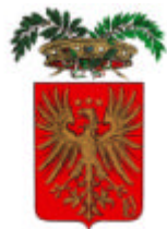
Provincia di Novara