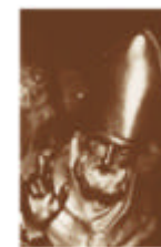
Diocesi di Novara

Progetto Culturale promosso dalla Chiesa italiana