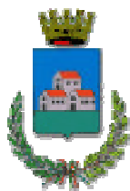
Comune di Trecate