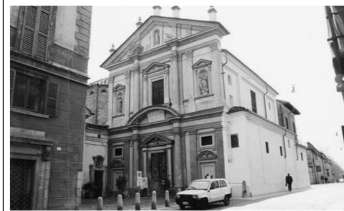
In San Giovanni Decollato «La passione terrena dei condannati a morte»