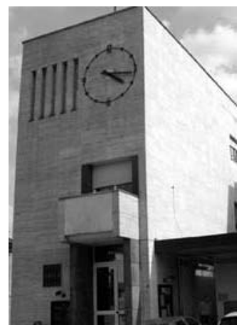
Il Cineteatro ospita i concerti